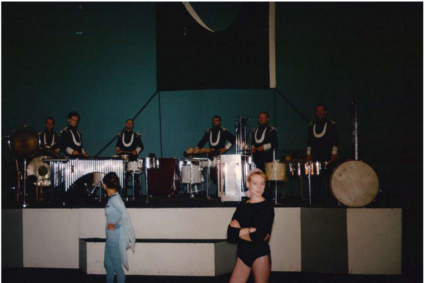
Avril 1965, création des « Huit inventions » de Kabelac, avec des danseurs

Dans cette composition culmine l'intérêt de cet auteur pour les instruments à percussion et pour la musique orientale qui s'est manifestée dans ses nombreuses œuvres précédentes. Certaines des Inventions sont librement inspirées par le Chant Grégorien* ( Corale ) ou par le dodécaphonisme* ( Aria ). D'autres sont des études sonores colorées ( Giubiloso ) ou rythmiques ( Scherzo , Danza , Diabolico ).