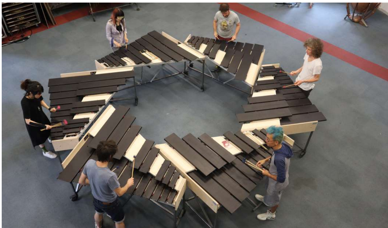
Réception des nouveaux sixxens, refaits en 2021

Philippe Manoury est un compositeur français, né en 1952. Il est inspiré par les grandes personnalités également proches des Percussions de Strasbourg : Pierre Boulez, Karlheinz Stockhausen ou encore Iannis Xenakis.