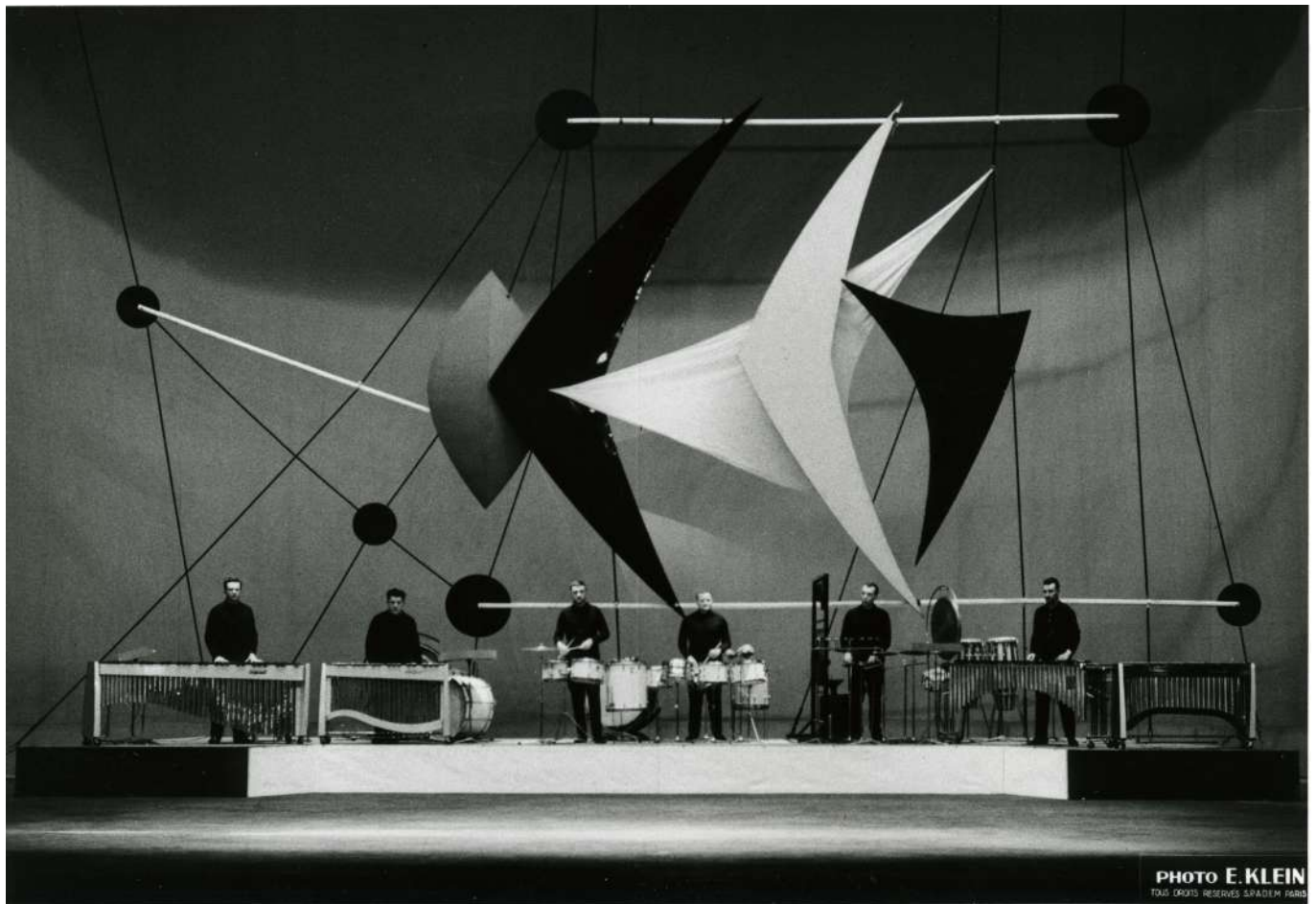
Première des « Quatre études chorégraphiques » de Maurice Ohana au festival de Strasbourg, 1965

Les Quatre Études chorégraphiques , dans leurs versions primitives furent conçues pour quatre instrumentistes, et écrites à la demande de la Nord-Deutscher Rundfunk. La formation du groupe de six percussionnistes de Strasbourg fournit à l'auteur l'occasion de remanier son œuvre, qui fut ainsi représentée pour la première fois au Festival de Strasbourg en 1963 dont le prolongement chorégraphique est confié à Manuel Parrès.