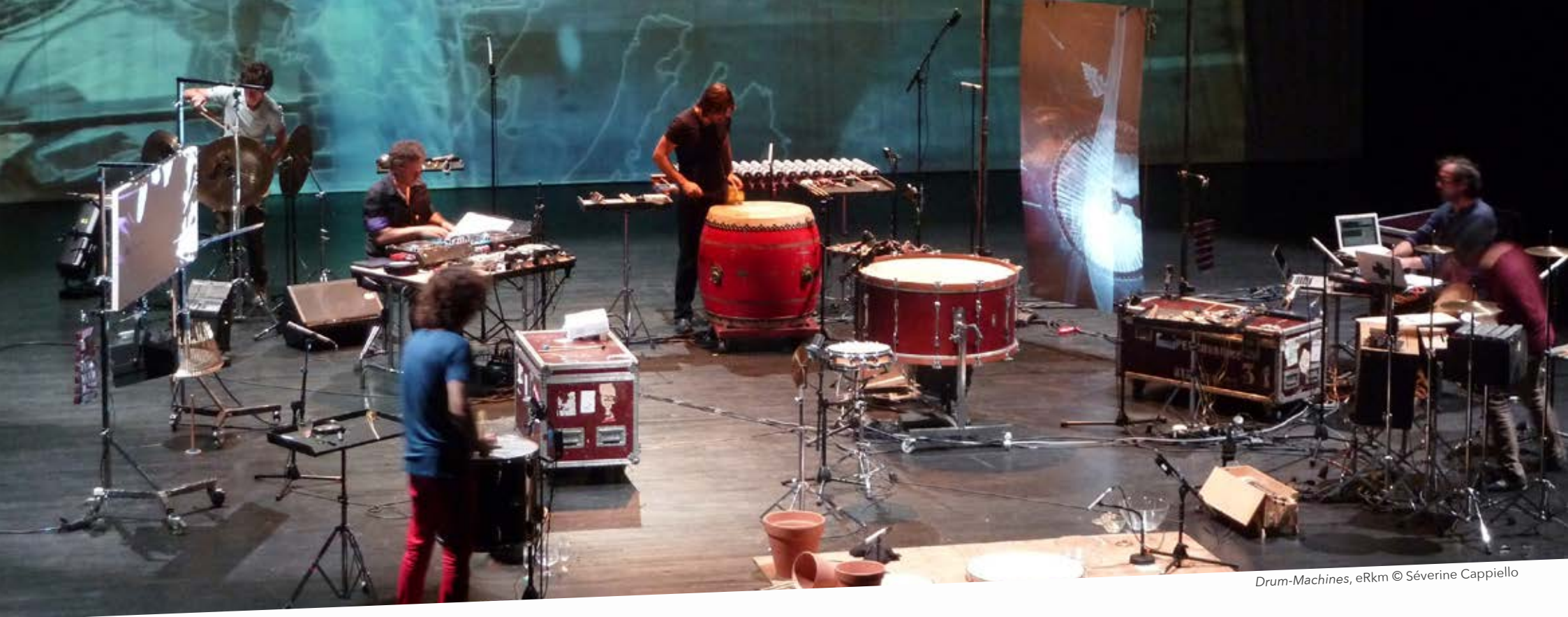
Drum-Machines, eRkm © Séverine Cappelletto