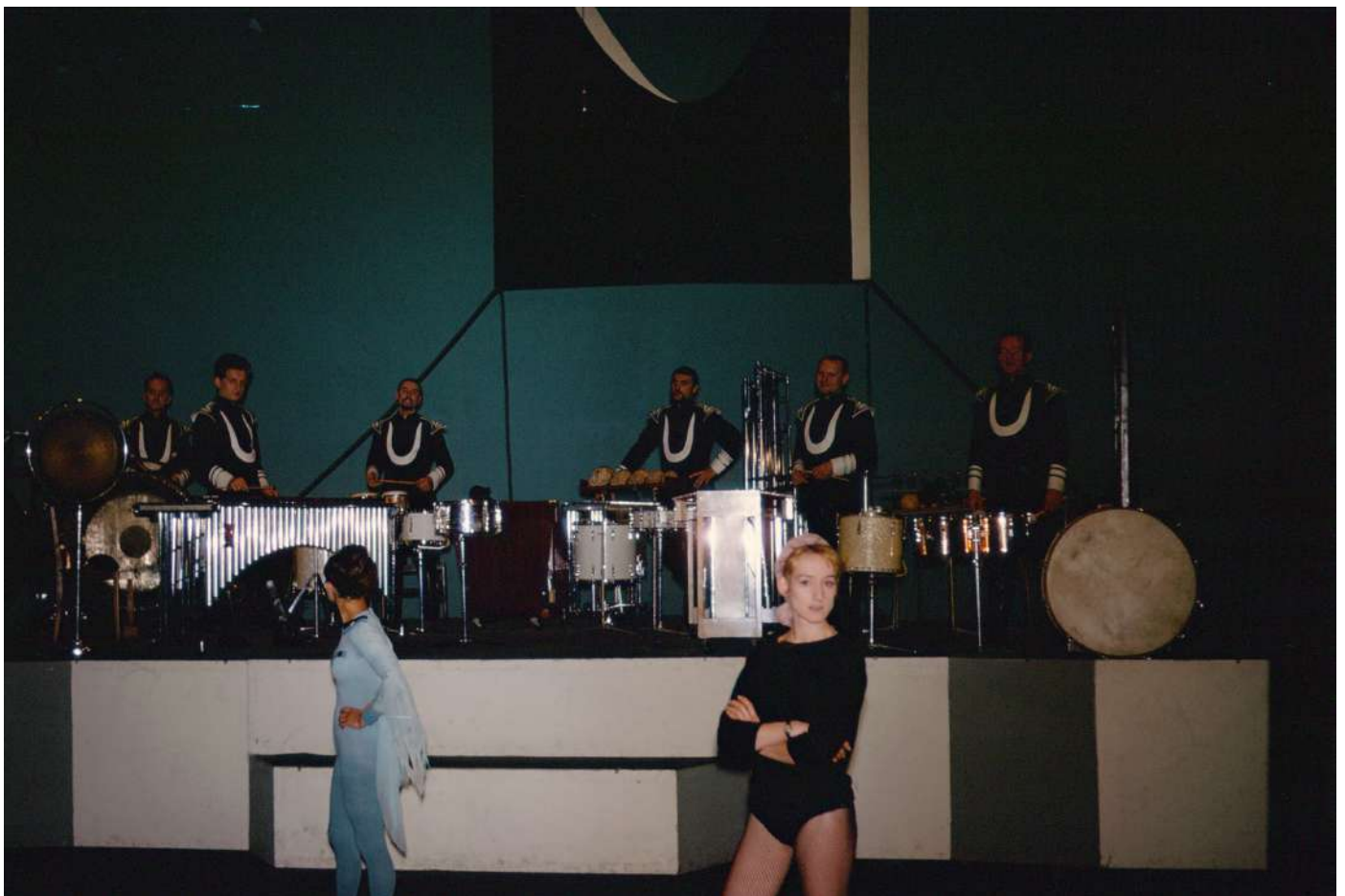
Avril 1965, création des « Huit inventions » de Kabelac, avec des danseurs

Dans cette composition culmine l'intérêt de cet auteur pour les instruments à percussion et pour la musique orientale qui s'est manifestée dans ses nombreuses œuvres précédentes. Certaines des Inventions sont librement inspirées par le Chant Grégorien* ( Corale ) ou par le dodécaphonisme* ( Aria ). D'autres sont des études sonores colorées ( Giubiloso ) ou rythmiques ( Scherzo , Danza , Diabolico ).