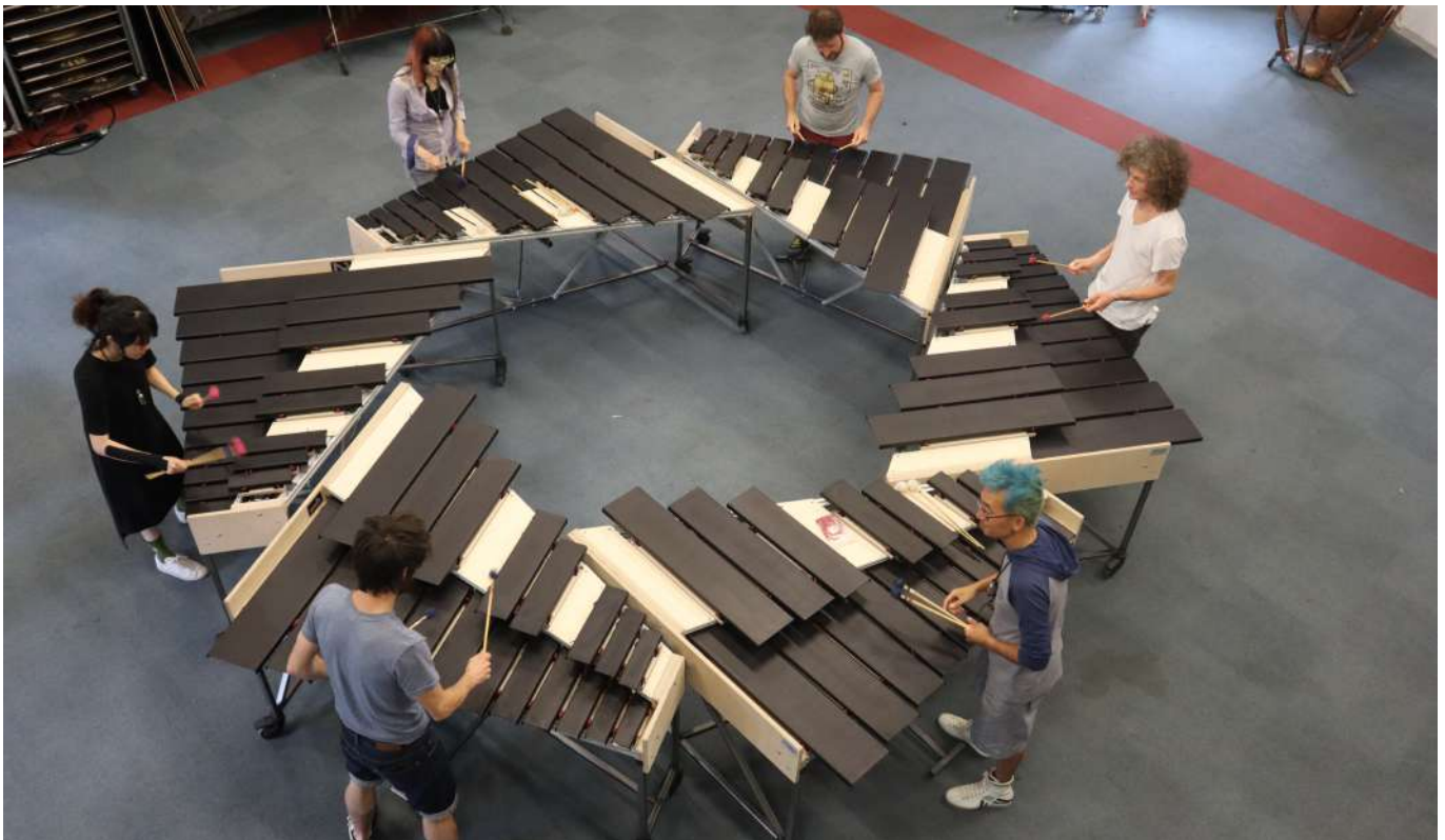
Réception des nouveaux sixxens, refaits en 2021

Philippe Manoury est un compositeur français, né en 1952. Il est inspiré par les grandes personnalités également proches des Percussions de Strasbourg : Pierre Boulez, Karlheinz Stockhausen ou encore Iannis Xenakis.