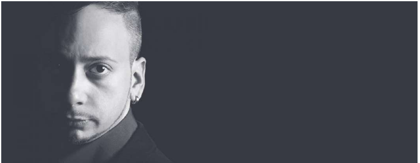
Portrait de Maurilio Cacciatore

Le titre « Corale », ou « chorale » en français, veut célébrer les nouveaux horizons de jeu que cette baguette peut offrir et l'univers sonore qu'il est ainsi nouvellement possible d'imaginer. Une technique innovante, dont émerge une nouvelle palette de timbres, qui vient enrichir l'écriture des instruments à percussions. Le titre fait également référence à la technique de composition, pensée et écrite à la manière d'une pièce à 3 voix chantées.