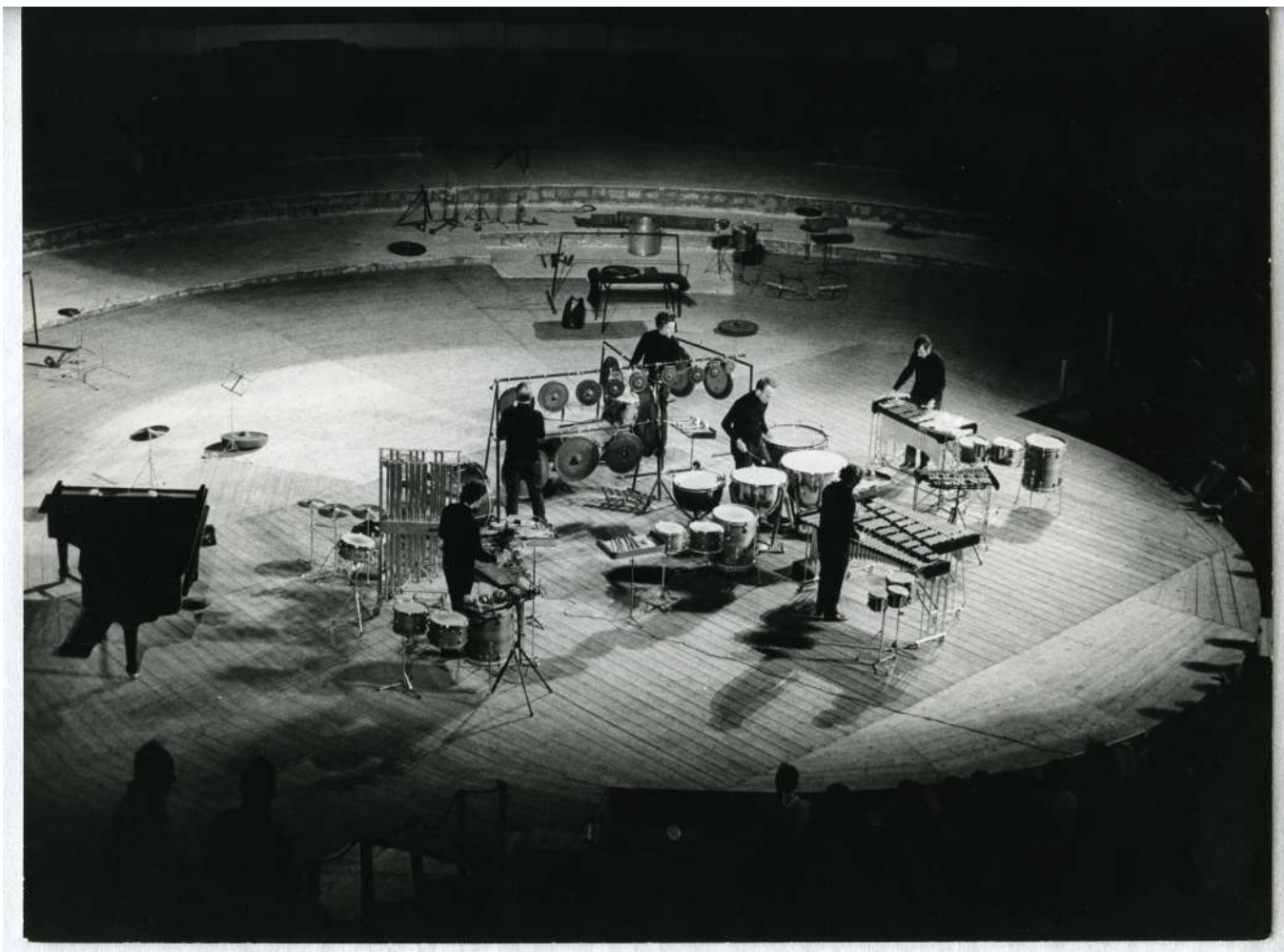
Centre culturel de Hammamet (Tunisie), août 1970. Au programme, les huit inventions de Kabelac

Miloslav Kabelac (1908-1979) est un compositeur et chef d'orchestre tchécoslovaque qui fera ses études au conservatoire de Prague à partir de 1928 et deviendra chef d'orchestre de la radio de la capitale tchèque. Ses recherches musicales le portent vers la musique électronique, dont il devient un porte-drapeau en Europe. Ses compositions comportent également de larges parties consacrées aux percussions.